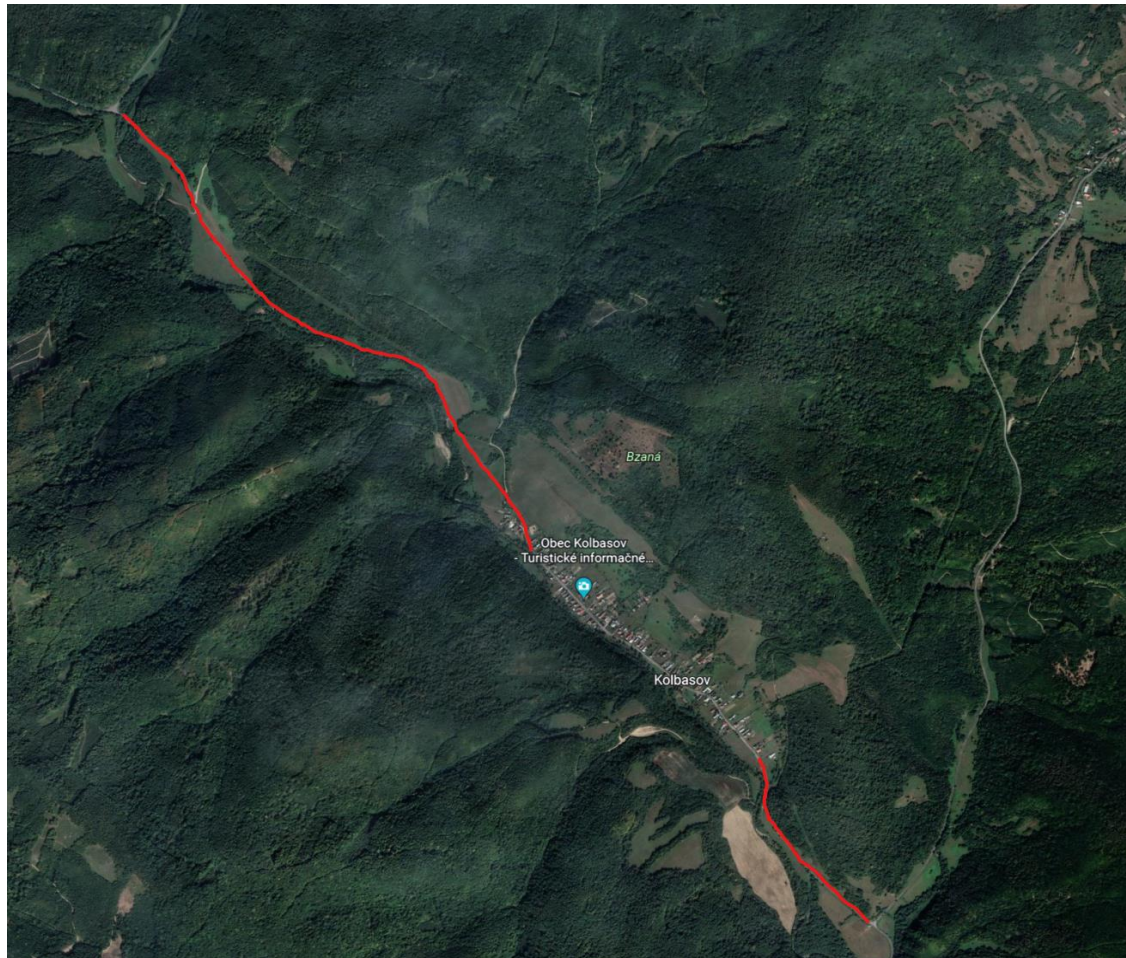
MAP of the situation of PREZAK 2