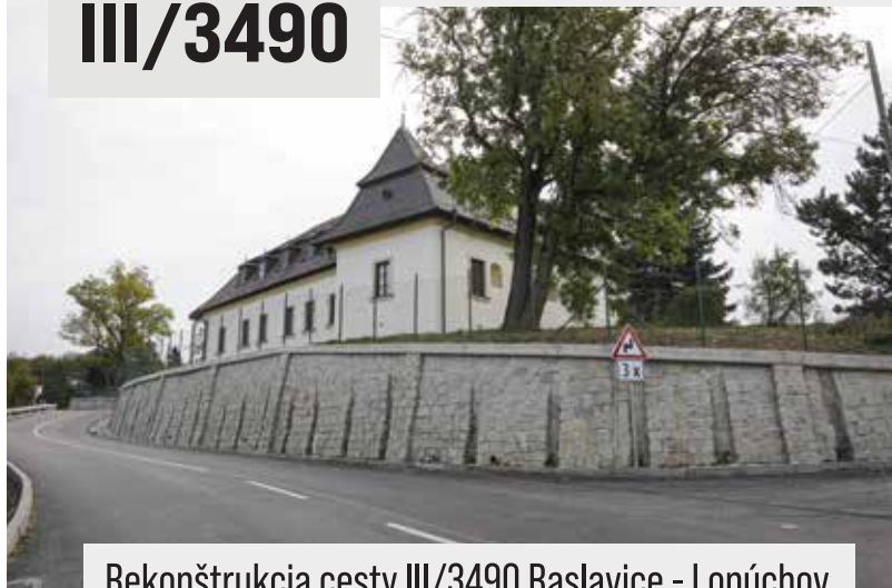
Rekonštrukcia cesty III/3490 Raslavice - Lopúchov

Polsko-słowacki obszar transgraniczny wymaga znacznych inwestycji, które przyczynią się do rozwoju i poprawy obecnej infrastruktury. Działania w ramach projektu są zaplanowane na obszarze, który ma wysoki potencjał przede wszystkim w dziedzinie turystyki oraz rozwoju współpracy transgranicznej. Obecny nie zadowalający stan infrastruktury drogowej spowodowany jest położeniem na terenie o charakterze górskim, co ma zasadniczy wpływ na wysokość nakładów niezbędnych do utrzymania i rozwoju sieci drogowej.